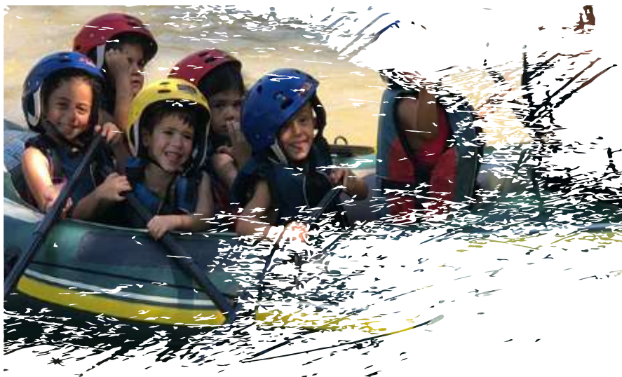
Tabla de precios