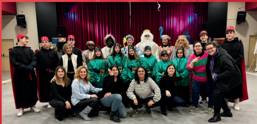
CABALGATA DE REYES CON LA A. AMAS DE CASA LA TORRENTINA