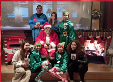
CASA DE SANTA CLAUS EN CASA FERRABRÁS