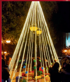
ENCENDIDO DE LUCES CHOCOLATADA