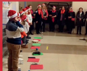
VILLANCICOS DE LA CORAL TORRENTINA Y NIÑOS DE CATECISMO 2024