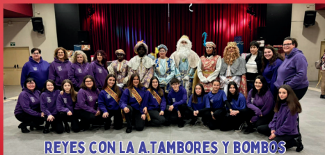
REYES CON LA A. TAMBORES Y BOMBOS