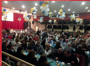
CENA DE NOCHEVIEJA Y COTILLÓN